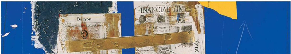
Ausschnitt aus 'Baryon AG', 2000, Rolf Ziegler